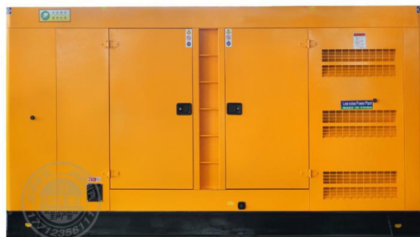
静音型机组 (需选装)